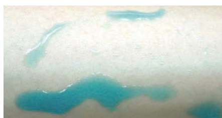
10% Glycerin aq. solution

SY-DP series spreads smoothly on skin with light feel and provides moisturizing effect. By combined use of glycerin, SY-DP series can provide not only less stickiness and smooth spread on skin, but also moisturizing effect attributing to glycerol moiety.