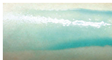
5% Glycerin + 5% SY-DP9 aq. solution